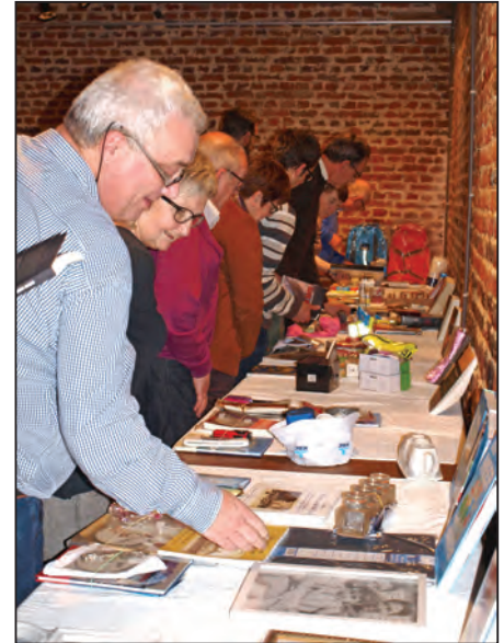
Er was veel interesse in de mooie prijzen bij de quiz van vorig jaar!