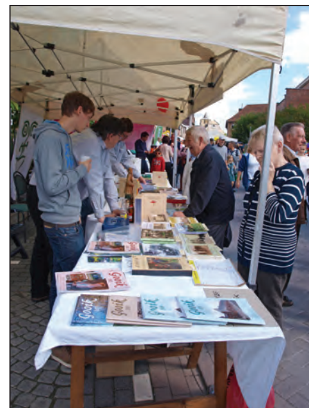
Een beeld van de uitstekende jaarmarkt van vorig jaar: veel belangstelling en een uitstekende verkoop

Het aanbod is al groot, maar zal tegen die zaterdag opnieuw worden uitgebreid, met het nieuwe boek 'Orgels in het Pajottenland'. Met de uitgave over de 'Gooikse, Leerbeekse en Oetingse handboogschutters' is er nu al keuze in 39 titels, die we uitgegeven hebben. Het is het moment om je collectie aan te vullen. Tot dan op onze stand in de Dorpsstraat!