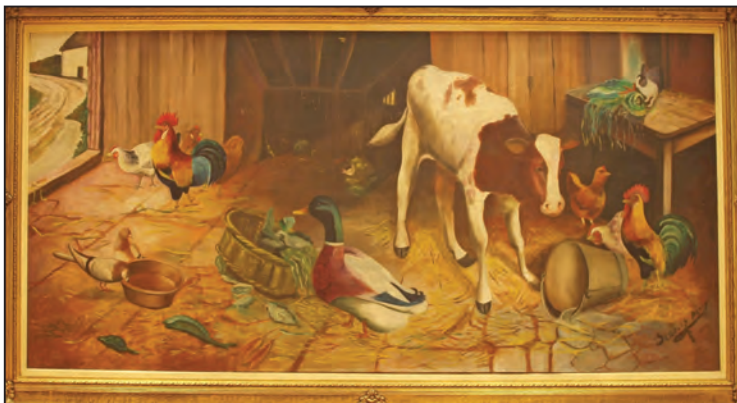
Het schilderij met het boerderijtafereel.