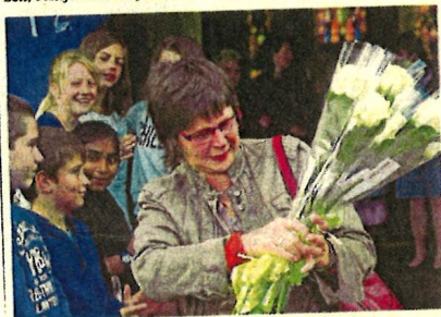
De juf neemt haar bloemen in ontvangst.

er les gaf. Collega's van juf Arlette vertrokken vrijdag al 's morgens vroeg met de huifkar om haar thuis in