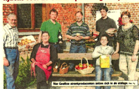
Vier Gooikse strookproducenten zetten zich in de etalage. Foto: 109

Een uitgave van de Heemkundige Kring van Gooik - 2014