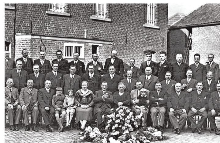
Viering 40 jaar brouwerij Eylenbosch in 1933.