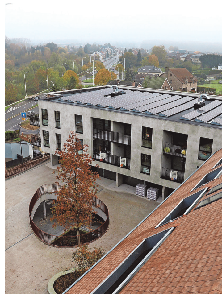
Een beeld vanop het uitkijkpunt.