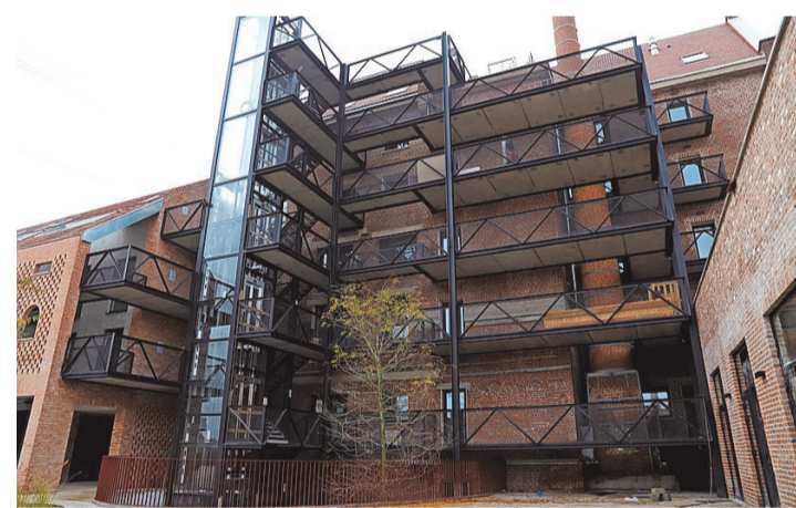
De stalen constructie met lift en trappen telt zes verdiepingen in totaal.