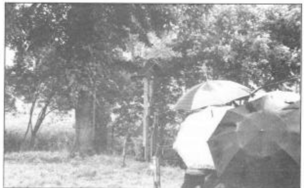
Inwijding van het Kruisbeeld... onder moeders paraplu.

Voor de inwandeling van het Landbouwleerpad kwamen er niettemin nog een 100-tal wandellustigen opdagen. Hoeveel mensen hadden er dan niet gestaan, indien de zon van de partij was geweest?