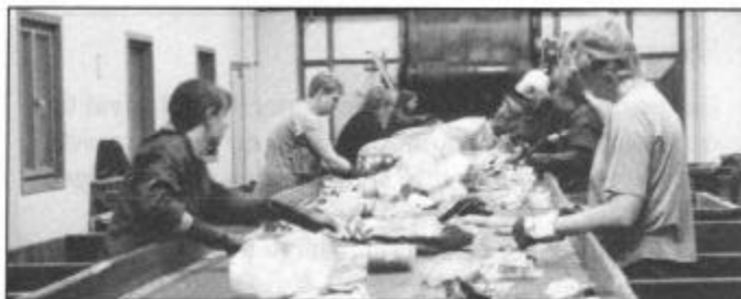
Het sorteren van P.M.D.-afval (met de hand)

FOST PLUS verleent steun aan de gemeente en de intercommunale voor de ophaling van PMD, papier en glas , zowel op financieel als op organisatorisch vlak en zorgt bovendien voor de recyclage of de nuttige toepassing van het ingezamelde verpakkingsafval.