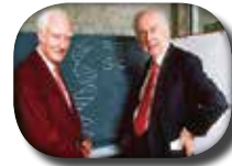
James Watson & Francis Crick Ontdekkers van de structuur van het DNA

of mail naar : egelantier1@telenet.be of Tel. 0475/89 10 67