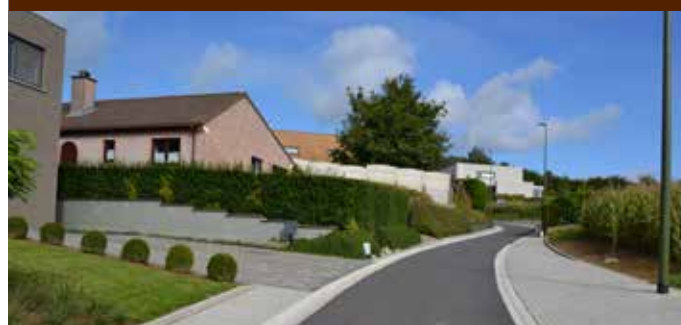
De werken aan de Gooikse Eeckelstraat zijn volledig voltooid.