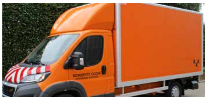
Het gemeentebestuur kocht een nieuwe bestelwagen die hoofdzakelijk zal gebruikt worden voor de diensten gebouwen en signalisatie.