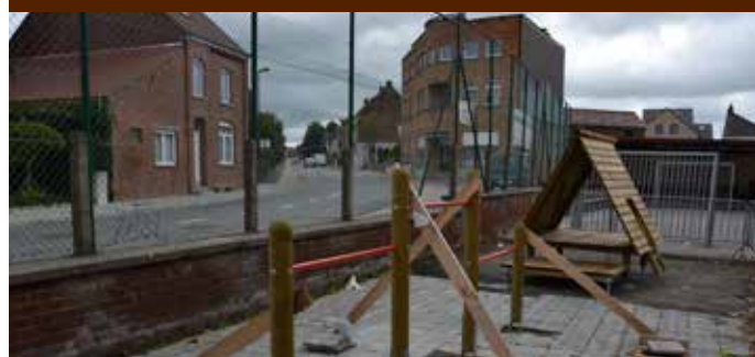
De speelplaats van de Oetingse dorpsschool De Oester kreeg nieuwe speeltuigen.