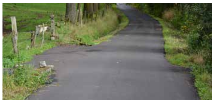
De Bettestraat werd in een nieuw asfaltkleedje gegoten.