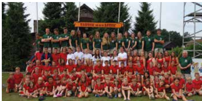
Chiro-Kester op bivak in Zutendaal

Nu gaan we ons 40ste levensjaar in. "Chiro-40" staat voor de deur. Met ons nieuw jaarthema CHIROCYCLE gaan we veel recycleren. Misschien graven we in ons Castrum echte Romeinen op en vinden we een Romeinse villa waar we ons chirolokaal kunnen van maken!