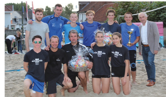
De voorstelling van het masterplan op zondag 20 augustus ging onder meer gepaard met een beachvolleybaltornooi.

Een ruime meerderheid van 7 op 10 kan zich vinden in de verhuis van de parkeerplaatsen. Met de aanleg van de nieuwe parking komen er hoe dan ook netto 20 plaatsen bij.