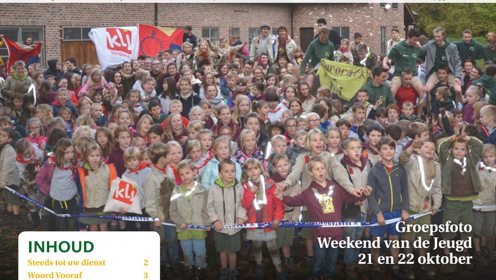
Groepsfoto Weekend van de Jeugd 21 en 22 oktober

Verschijnt driemaandelijks • 20 december 2017 • V.u. Gemeentebestuur Gooik, Koekoekstraat 2, 1755 Gooik