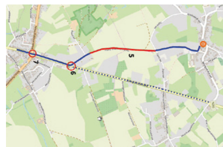
Voorbeeld van een gewenst lokaal functioneel netwerk