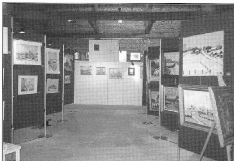
Heemkundige Kring van Gooik

Onderaan een mooi beeld van de tentoonstelling in de Schuur van De Cam, rechts heel wat interesse op de vernissage van vrijdagavond.