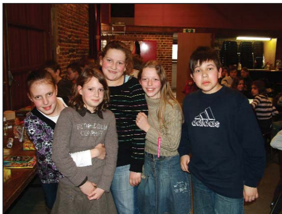
Boven de tweede ploeg "De Bollekens" uit Kester. In het midden en onderaan de foto's van "De Bubbles" uit Gooik en "De Bedenkers" uit Kester, die beide als derde eindigden.

In ieder geval, op die bewuste zondag 6 april,