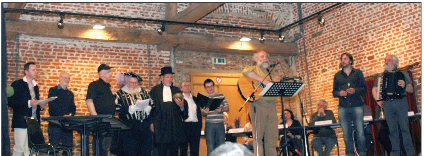
Onderaan alle deelnemers van “Op zè Pajots” in Gooik bij de afsluiting van de voorstelling.