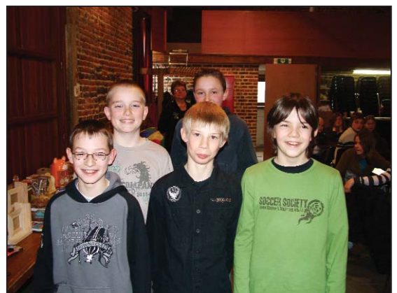
De winnaars van de scholenquiz: "The play brain" uit Strijland.