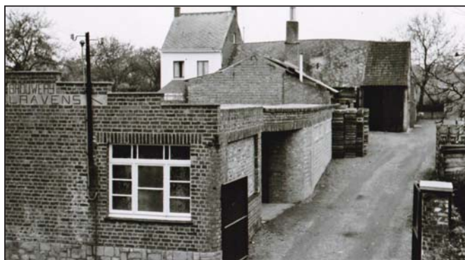
Een mooie oude foto van de brouwerij Walravens in Kwakenbeek.

Van een aantal leden ontvingen we mooie oude foto's (o.a. van Agnes Walravens (over de brouwerij Walravens en andere beelden uit Kwakenbeek), van