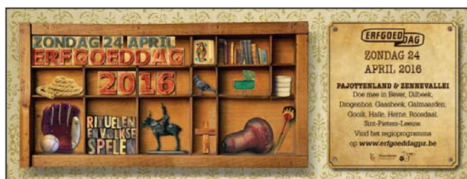
De mooie banner van de Erfgoeddag 2016: de volksspelen staan centraal! (Ontwerp Erfgoedcel PZ)

Als dit tijdschrift verschijnt is het nog een goede maand eer de volgende erfgoeddag eraan komt, dus echt niet meer zo ver in de tijd! De vergaderingen met de verantwoordelijken van de Erfgoedcel PZ zijn achter de rug, het thema in onze streek ligt vast: 'volkssporten en volksspelen' ('nationaal' thema is 'Rituelen') en de ontwerpen van flyers en affiches zijn klaar – waarvoor opnieuw onze hartelijke dank aan de mensen van onze Erfgoedcel. Het zijn weer pareltjes van ontwerpen geworden! Je vindt trouwens een flyer met onze activiteit in dit tijdschrift. Kruis direct de datum aan van die zondag, want het wordt een leuke dag, met allerlei activiteiten! Omdat er voor onze Kring toch heel wat staat te gebeuren, komen we op deze dag terug in een apart artikel. Lees zeker verder daar!