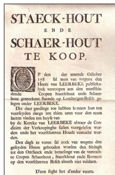
Het oude document, verwijzend naar een verkoop in Leerbeek.

Een uitzonderlijk 'pamflet', in een zeer goede staat, en in een 6-tal exemplaren.