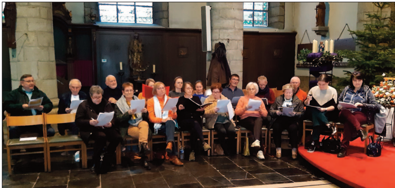
En of ze ervoor gaan, deze zangers en zangeressen! En in het 'Guuks' dan nog wel. Een beeld van het uitgebreid kerkkoor van de parochie, dat repeteert voor de Kerst-mis in het dialect op Kerstavond.

De 'Kèssemès' gaat door op zondag 24 december e.k. in de Sint-Niklaaskerk in Gooik-centrum om 17u. Men start al met zingen om 16u30. Daarna is er ook nog een samenkomst moment voorzien, waar er kan nagepraat en -gedronken worden, onder de Gooikse tenten, met warme soep aangeboden door de vrijwilligers van Samana. Iedereen welkom!