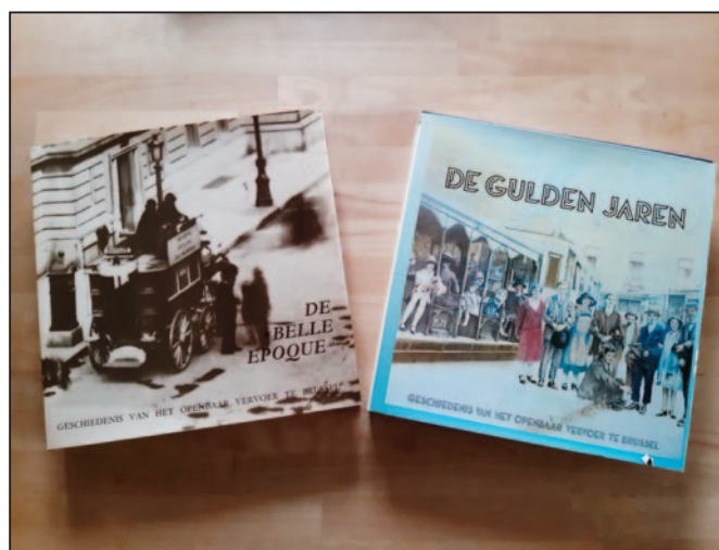
Twee boeken over de Brusselse trams van vroeger, mooie herinneringen.