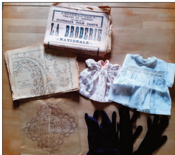
Oude patronen en oud handwerk.

Een tijd geleden kregen we van Armand ook al een aantal foto's waarop de fanfare van Wambeek te zien is tijdens een optocht in Gooik. We tonen hier één van de foto's, met de bedoeling van hier reacties op te krijgen en er een volgende keer iets rond te schrijven.