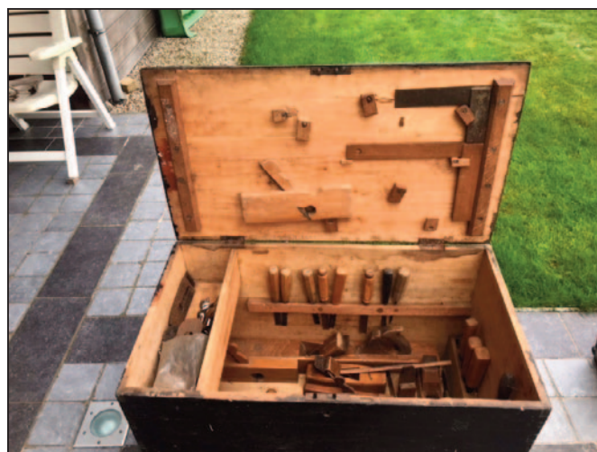
De kist met timmermansgerief.

Lid Eddy Penne bezorgde ons een kist met specifiek timmermansgerief. De kist bevond zich in de woning van zijn schoonouders en zou vermoedelijk van rond de jaren 1930-40 zijn. We vonden het de moeite waard om te houden, met al deze oude materialen, en de koffer maakt nu deel uit van onze grote verzameling oude werktuigen.