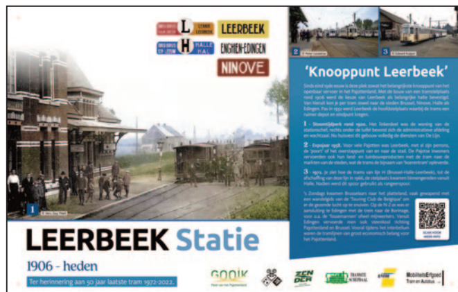
Het bewuste fotobord, met één mooie grote foto, twee kleinere, een tekst met uitleg en een QR-code met nog meer achtergrondinformatie.

ren dat het nu iets meer dan 50 jaar geleden is dat de laatste tram hier bij ons gereden heeft, nl. in september 1972.