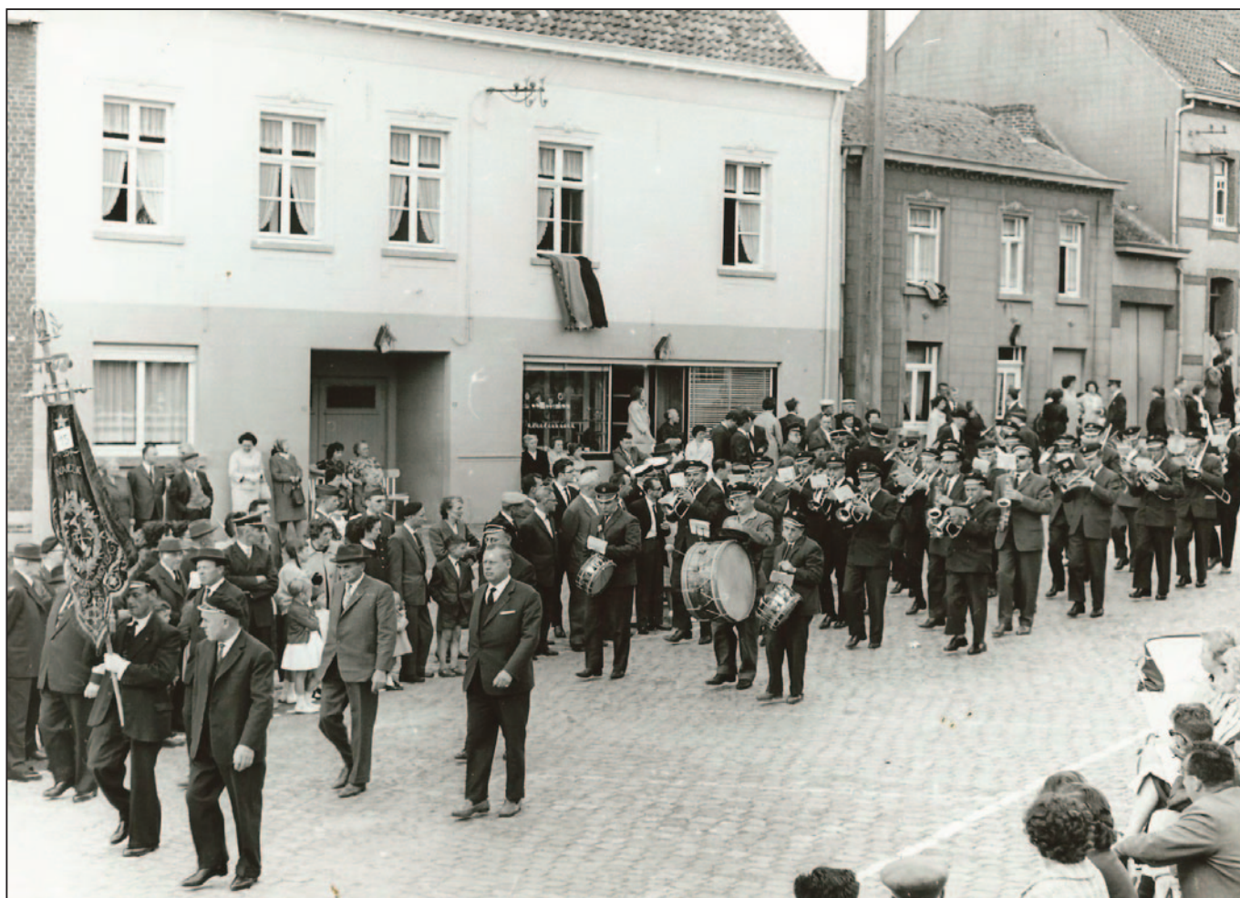
De foto van de Wambeekse fanfare in het centrum van Gooik.