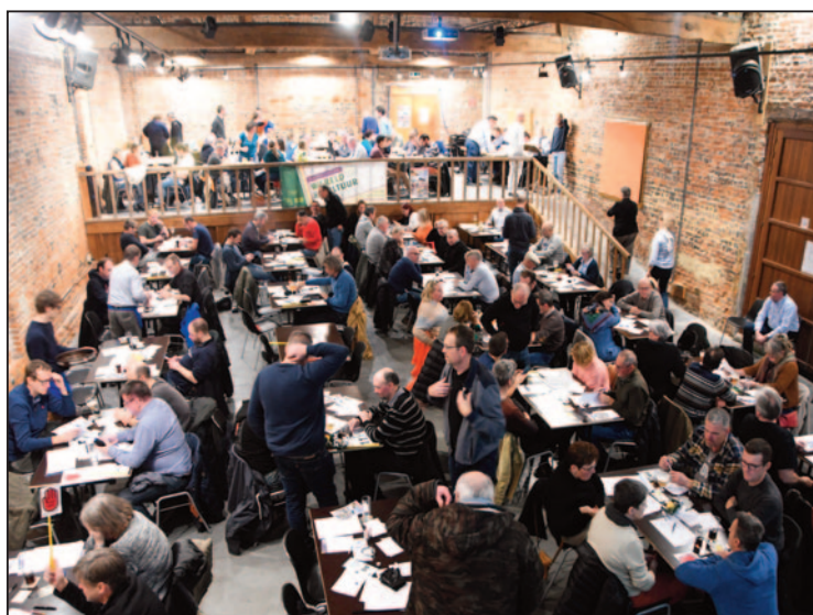
Een algemeen zicht op de schuur, met de 31 ploegen even in rustmodus tijdens de pauze. Er kan even uitgeblazen worden om er dan weer volop tegenaan te gaan.