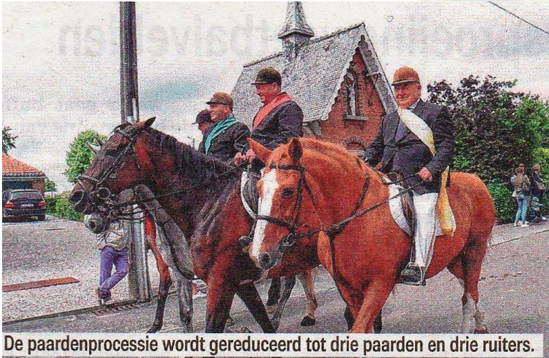
De paardenprocessie wordt gereduceerd tot drie paarden en drie ruiters.